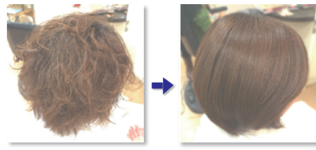
縮毛矯正施術前 施術後

ダメージの修復&予防 システイン酸の生成を抑制 ウェーブ効率UP ハリ・コシ弾力UP マトリックスを補修 保湿&エモリエント効果 保護皮膜の形成