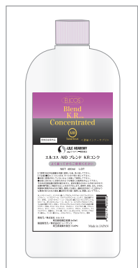
400ml (システイン入“ケラチン乳液”)