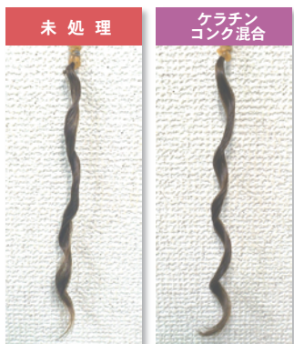
※ハイダメージ毛にパーマ(ロッド=14mm)