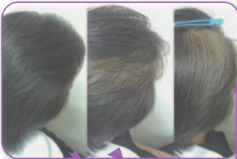
※アシッドイレイザーにて 15~20分加温の結果