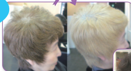
※アシッドイレイザーにて 30分加温×2回施術の結果